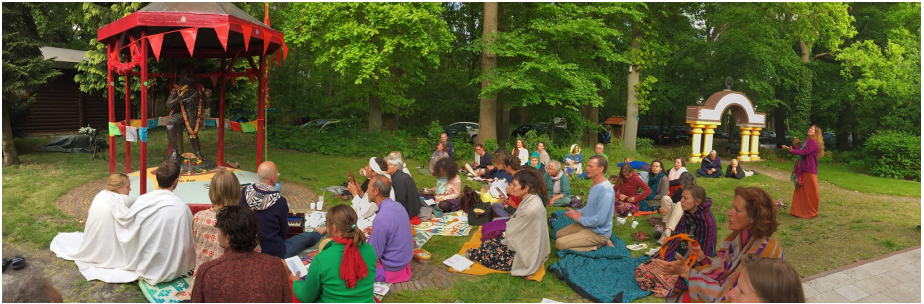
Kirtan (boven) en Hospitaal actie (onder) – 29-31 Mei 2015 links: actietent SSD – rechts: oogoperaties in India