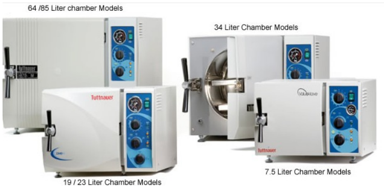
Foto: Voorbeeld van sterilisatie apparatuur