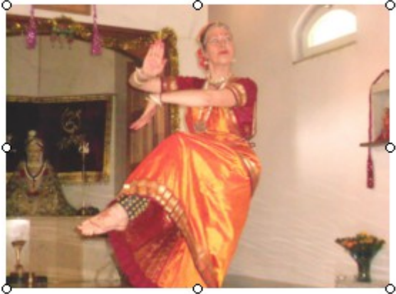
Na de havan indiase dans opvoering