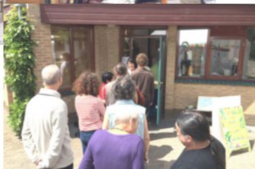
Boven: voor versnaperingen naar de Chai Shop. Onder: in de rij voor de lunch.