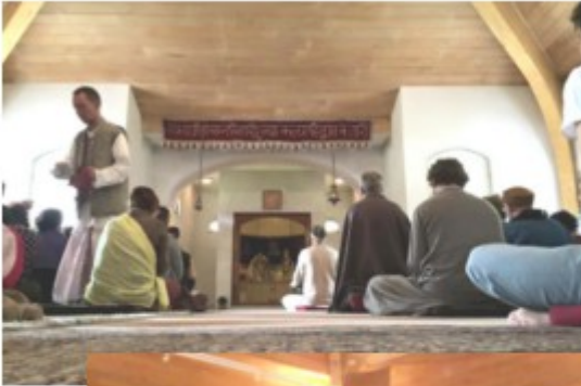
Aarti in de tempel